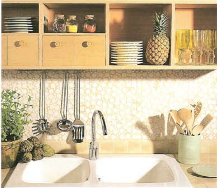
Crédence : décor Cabourg S, joint beige. Plan : Progression 75 Gravier.