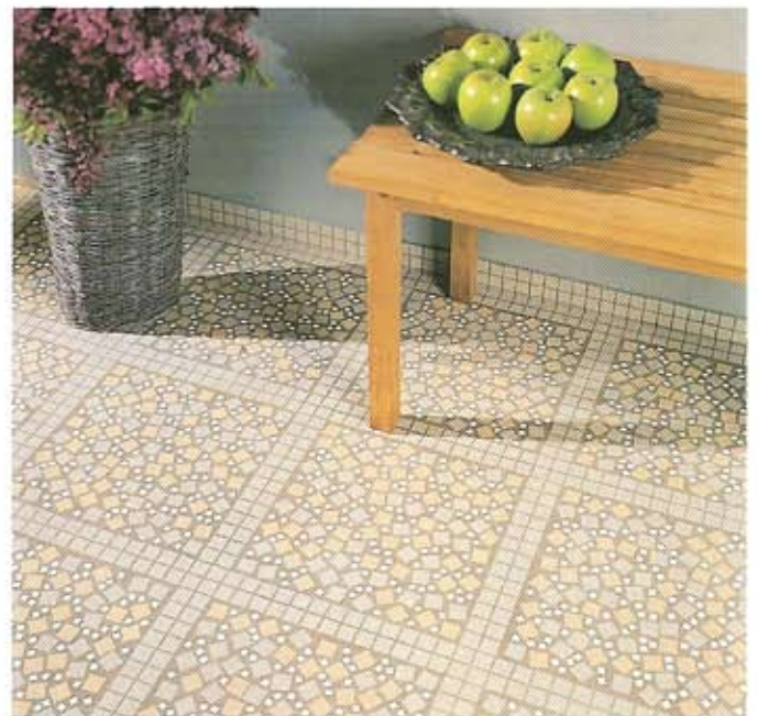
Sol / Floor : décor Zeebrugge, Mazurka Cendre, joint gris.