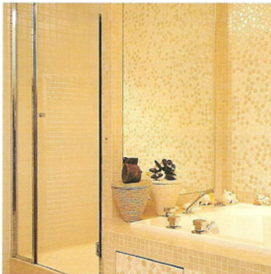
Murs baignoire / Bathtub wall : Marienbad modifié et Harmonies.

The color of the grout has to be matched carefully with the color of the tiles.